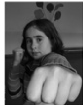
de Kickboxing do Clube Desportivo Escolar Biscoitos

Há pessoas que gostam de ganhar e conseguem à primeira e memorizam as técnicas.