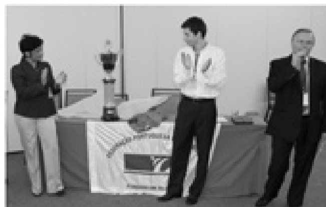
APRESENTAÇÃO OFICIAL DA TAÇA DE PORTUGAL que este ano se realiza em Torres Vedras