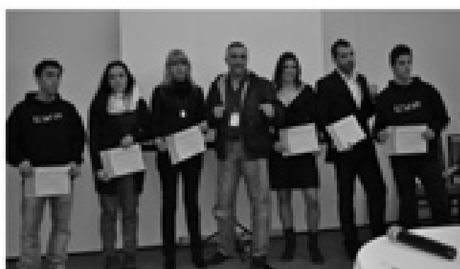
ATLETAS QUE REPRESENTARAM A SELECÇÃO NACIONAL receberam Menções Honrosas