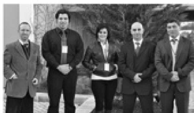
"COMITIVA AÇORIANA" presente no III Congresso Nacional de Kickboxing